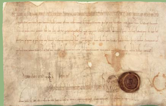
Arnulf 889 Oktober 5

International Centre for Archival Research Spengergasse 56/6 A-1050 Wien Tel./Fax: + 43 (0) 1 / 545 0989 Email: info@monasterium.net