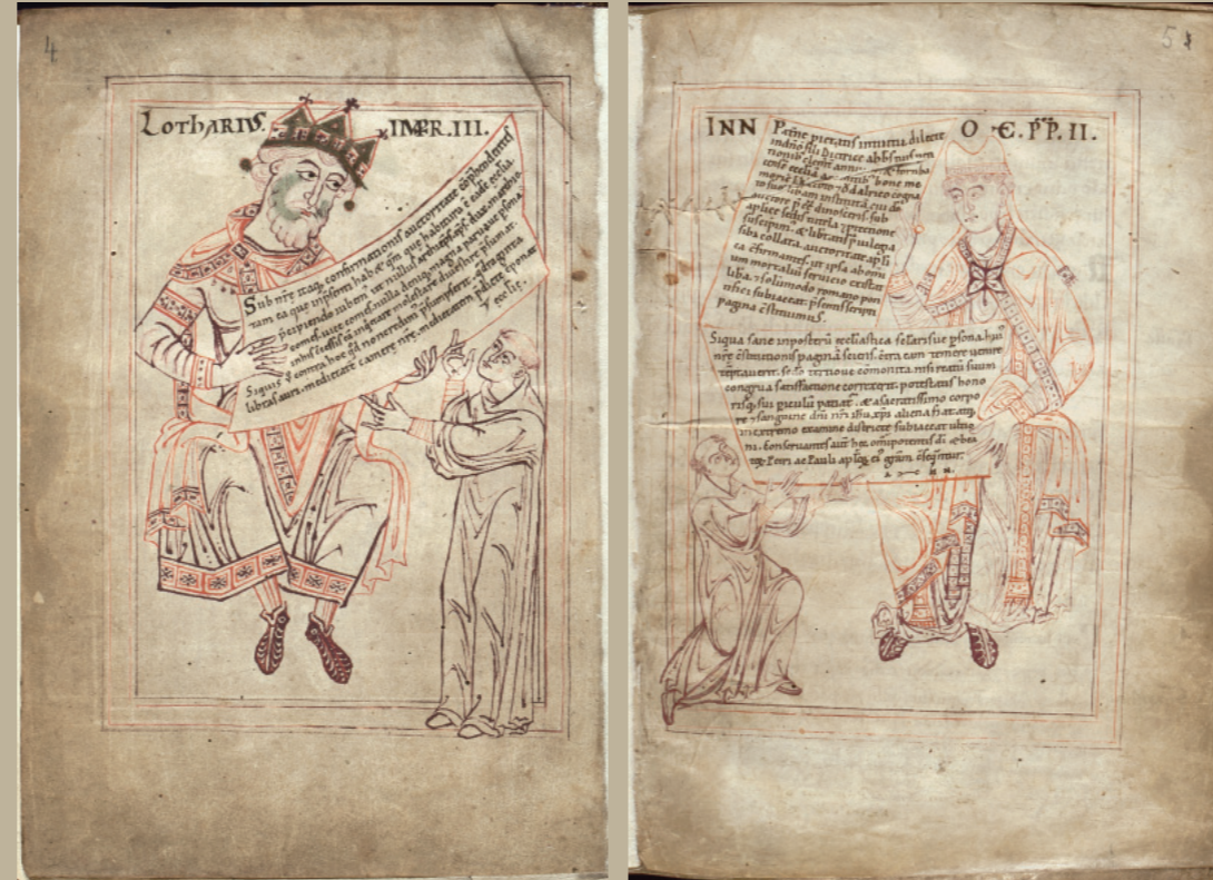
Kaiser Lothar III. († 1137) und Papst Innozenz II. († 1143) übergeben an den Abt von Formbach Privilegien (Bayerisches Hauptstaatsarchiv, KL Formbach 1)

Textierung: Dr. Joachim Kemper, Generaldirektion der staatlichen Archive Bayerns