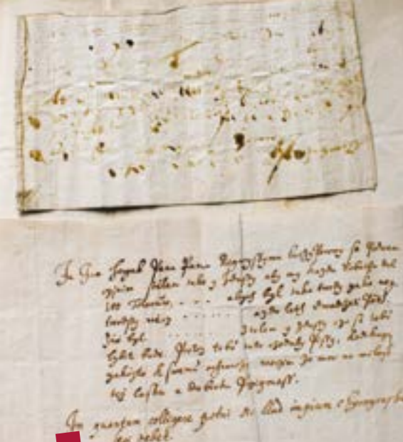
Der Pakt mit dem Teufel. NA, APA I, Inv. Nr. 5445, Kart. Nr. 4480