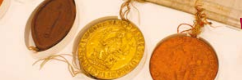
Die Goldene Bulle von Přemysl Otakar I. auf der Urkunde für das Kloster in Břevnov vom 24. Juli 1224. NA, ŘBB, Inv. Nr. 10