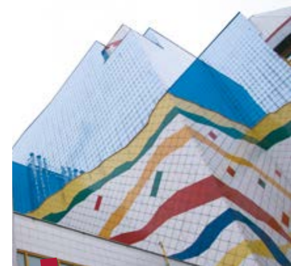
Scheinbar nahtlos gehen die obersten Geschosse der Depots in den Himmel über. Das Gebäude an sich ist so farbenfroh wie die Arbeit der ArchivarInnen vielfältig.